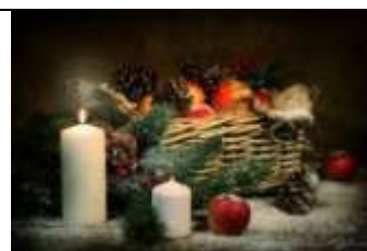
А) Новый год